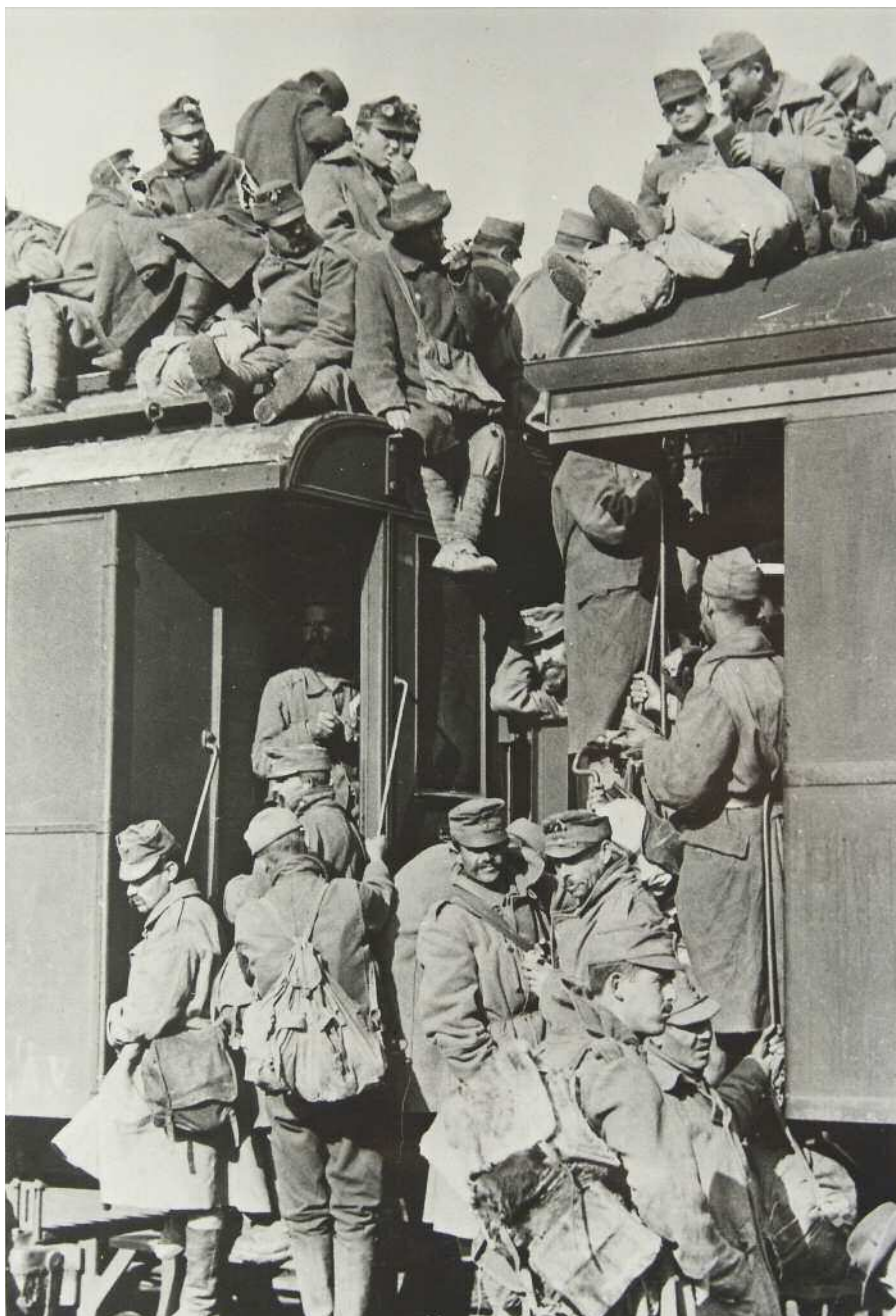
Frontról hazautazó katonák, 1918

zetőrségeket ebben elsősorban saját városaik közbiztonságának megvédelése, illetve az osztrák tartományokat rendkívül súlyosan érintő élelmiszerhiány motiválta.