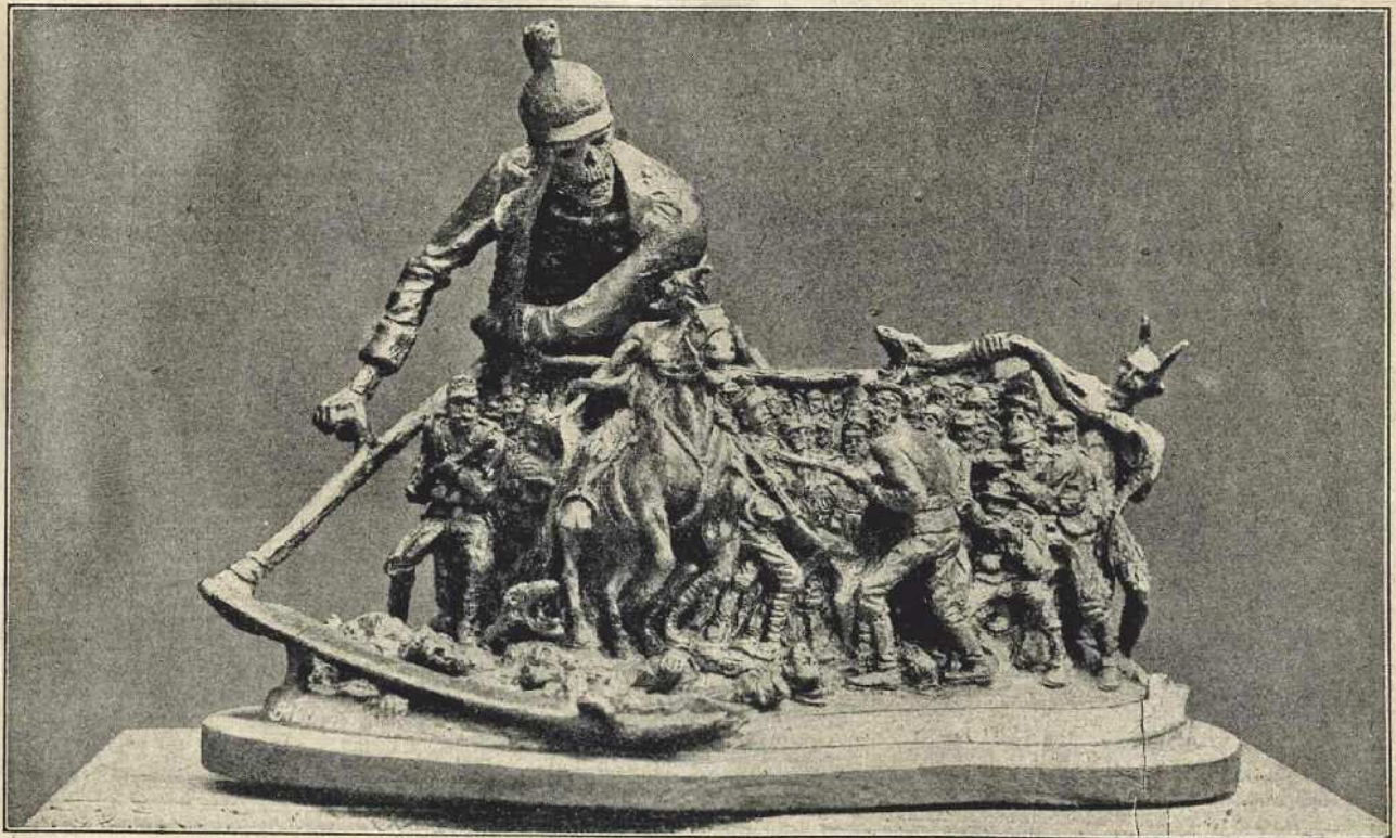
Ez a szoborcsoportozat egy székely katona (egyszerű munkás) alkotása. Gyimesi Bálint Lázár a szobrász neve és a csoport megrázó, drámai erővel ábrázolja a háború borzalmaival. A sisakos csont-ember kaszája széles rendet vág katonákban és polgároknak egyaránt, nagy öröme a csoport jobb sarkában ujjongó ördögnek.