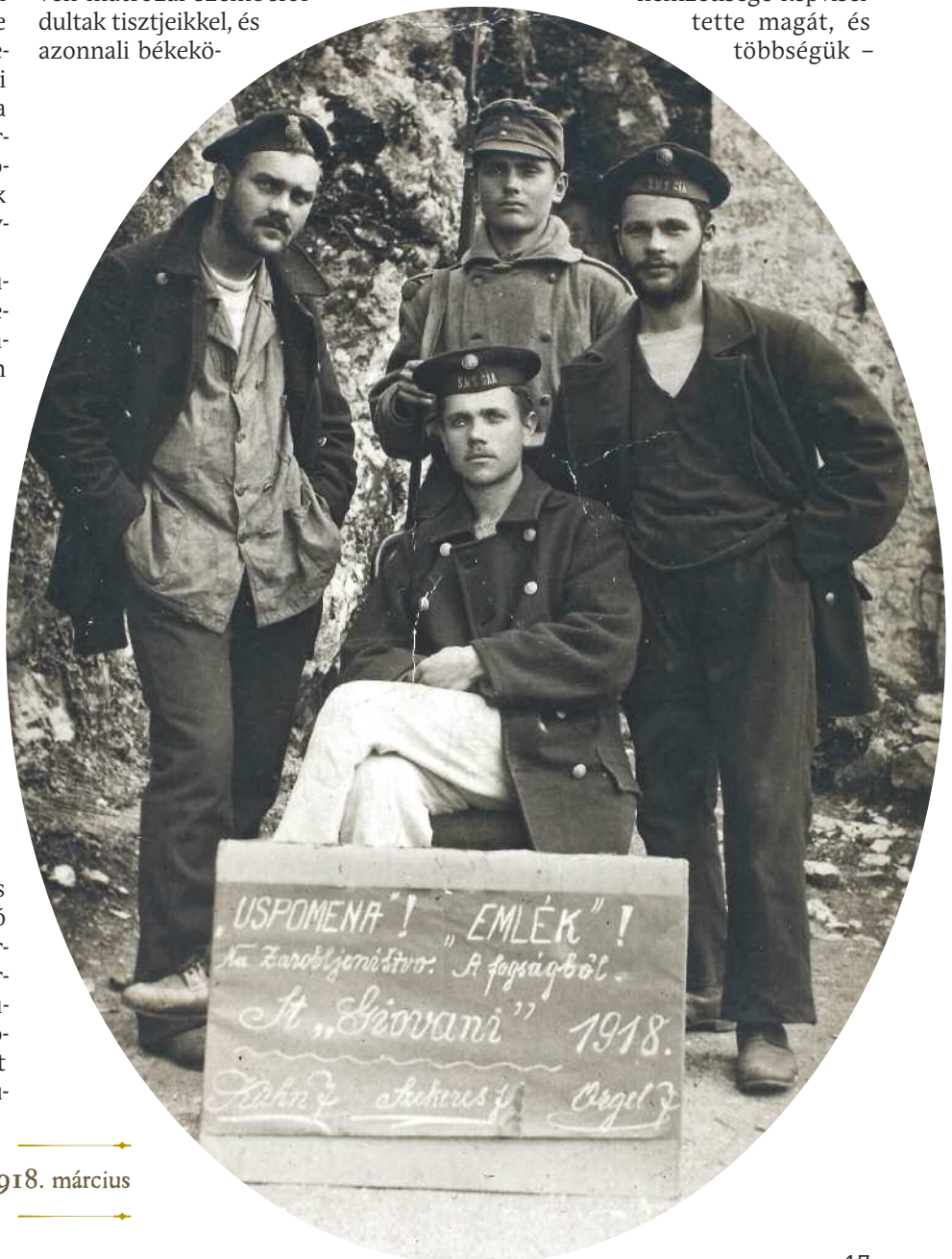
Cattarói felkelő matrózok, 1918. március

A felkelés vezetőinek egy része elmenekült, az elfogott főszervezők közül négyet halálra, a többieket börtönbüntetésre ítélték. A cattarói matrózlázadást az 1945 utáni jugoszláv történetírás egyfajta délszláv nemzeti-kommunista mozgalomként mutatta be. Azt azonban fontos látni, hogy a felkelők között a Monarchia mindegyik nemzetisége képviselte magát, és többségük –